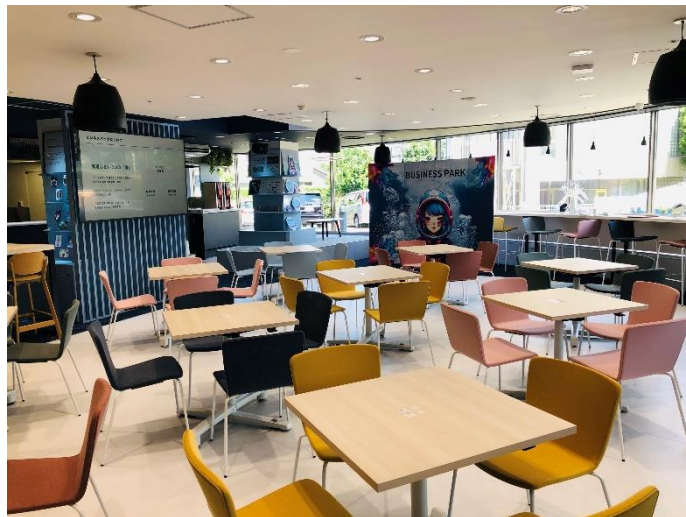
<コミュニティエリア>